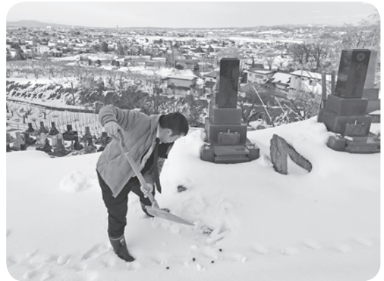
周りのお墓にも気を付けながら慎重に雪かきをしました。景色もよくて掘り終わった後は気分爽快です。