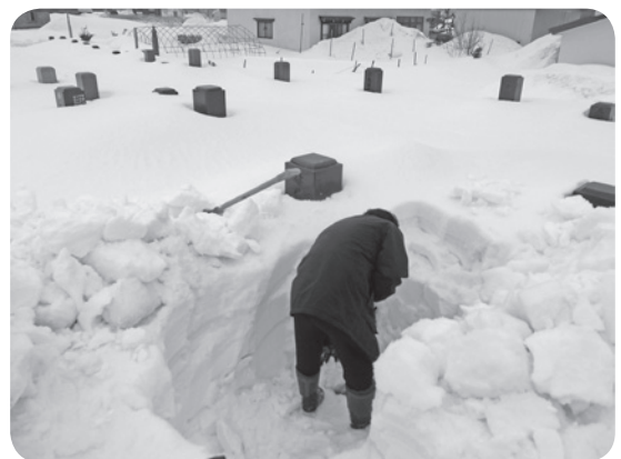
ちなみにこちらの写真は、12年前の3月上旬に撮影した、とある墓地の積雪状況です。周りにちょっとだけ見えるのが、なんと比較的背が高い和型のお墓の頭部分です。こんなにも違うんですね。